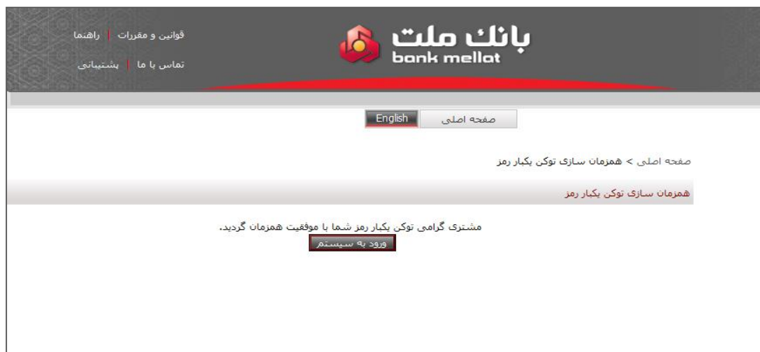
شکل شماره ۱۱- موفقیت در همزمان سازی توکن یکبار رمز

پس از طی مراحل مذکور، با صفحه ای مطابق شکل شماره (۱۱) مواجه می گردید. این بدان معناست که توکن یکبار رمز شما با موفقیت با سیستم بانک همزمان گردید.