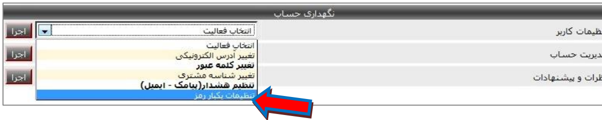
شکل شماره ۲- دسترسی به تنظیمات یکبار رمز

نکته (۴): نحوه تایید صفحه تنظیمات یکبار رمز در دسترسی های بعدی متفاوت بوده و همانند شکل شماره