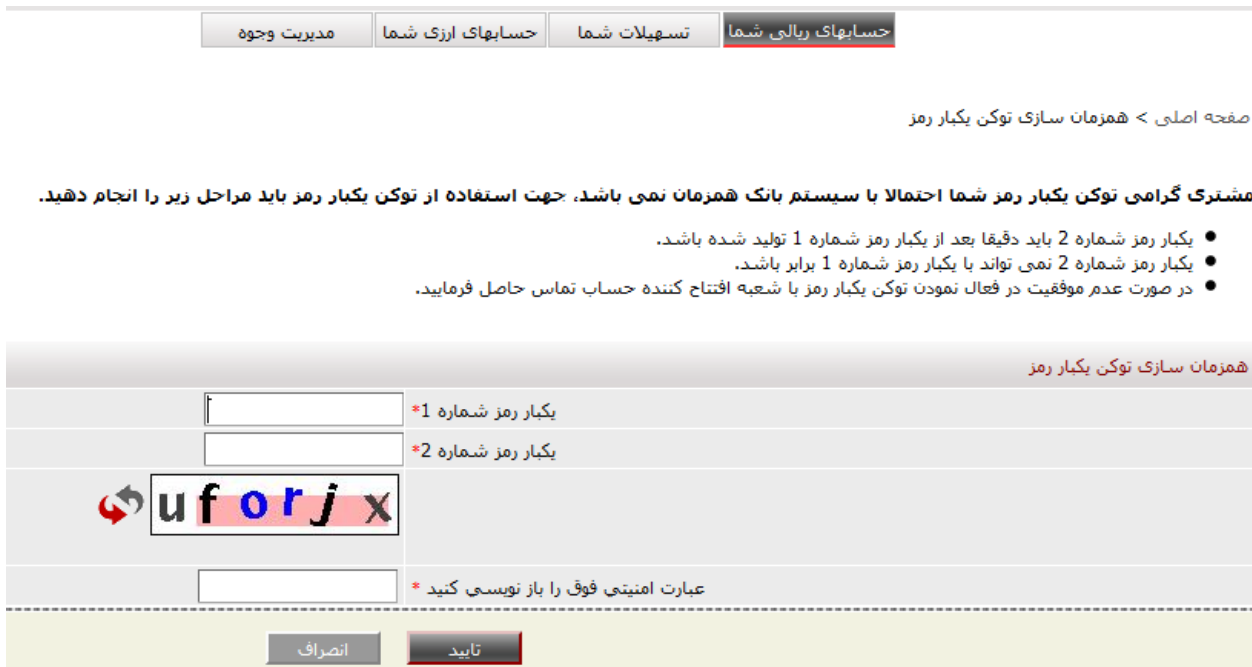
شکل شماره ۱۰- همزمان سازی دستگاه توکن یکبار رمز

در صورتی که هنگام ورود به سامانه بانکداری اینترنتی، بخش " یکبار رمز " را ۳ مرتبه به صورت متوالی اشتباه وارد نمایید، مطابق شکل شماره (۱۰) وارد صفحه همزمان سازی توکن یکبار رمز می شوید.